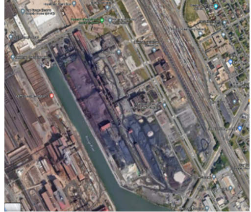
Figura1: Vista aérea de Cleveland-Cliffs

Cleveland Cliffs opera una fábrica de hierro y acero ubicada en Dearborn dentro del Complejo Industrial Rouge. La planta produce bloques de acero a partir de menas de hierro y realiza operaciones de refinamiento sobre boninas planas enrolladas de acero. Las operaciones de la fábrica de acero ocupan aproximadamente 500 acres en la mitad sudeste del complejo e incluyen equipos para fundir y moldear metal. Hay partes de la fábrica controladas por un dispositivo denominado precipitador electrostático o ESP con la función de reducir contaminantes en el aire durante el proceso. Este equipo de control fue instalado en 1964 y, aunque se realizó mantenimiento, el ESP no ha sido renovado o reemplazado por completo desde su instalación.